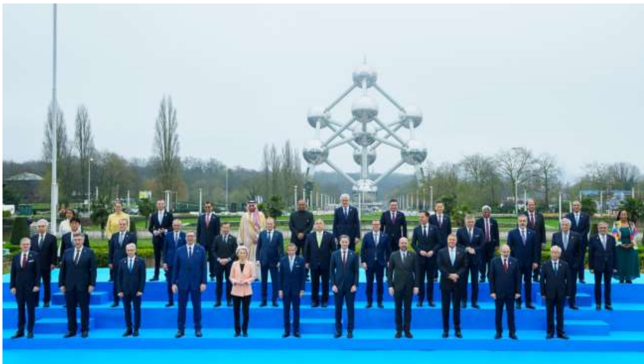
Participarea Președintelui României la Summitul Energiei Nucleare de la Bruxelles (21 martie 2024)