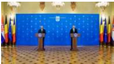
Pentru mai multe imagini click pe poză

Îi vom găzdui împreună pe Prim-miniștrii din Belgia, Ungaria și Croația în contextul unui proces mai amplu de consultări cu liderii statelor membre ale Uniunii Europene.