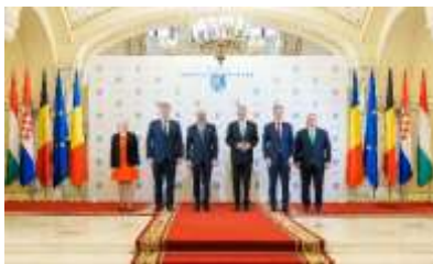
Pentru mai multe imagini click pe poză

Concluziile acestor consultări, inclusiv concluziile dezbaterilor de astăzi, se vor reflecta în documentul strategic care urmează, pe urmă, să fie adoptat de Consiliul European, probabil la finalul lunii iunie.