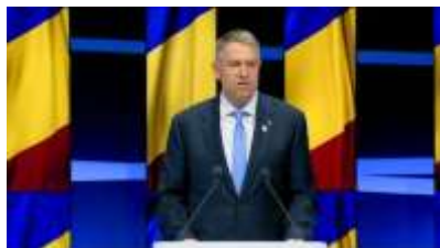
Pentru mai multe imagini click pe poză

Acest summit are o semnificație profundă, fiind organizat ca urmare a includerii emblematică a energiei nucleare în Evaluarea Globală la COP28 în Dubai. Schimbările climatice reprezintă o provocare globală care necesită acțiune coordonată și măsuri ambițioase.