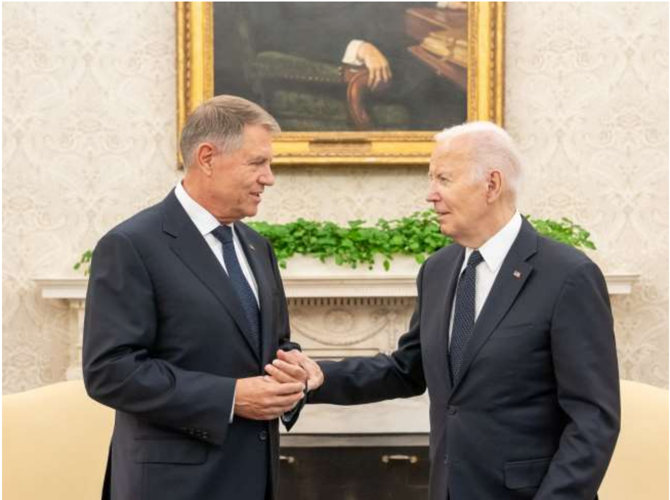
Primirea Președintelui României de către Președintele Statelor Unite ale Americii la Casa Albă (7 mai 2024)