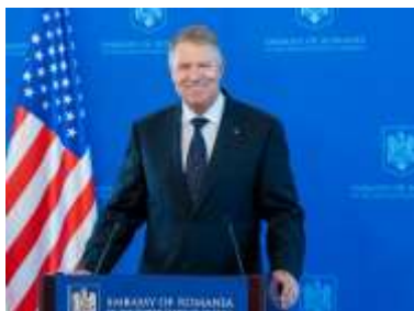
Pentru mai multe imagini click pe poză

Am discutat cu Președintele Biden despre Parteneriatul Strategic dintre țările noastre, cum îl putem face mai puternic și cum îl putem aprofunda, astfel încât să răspundă provocărilor cu care ne confruntăm în acest context global extrem de complicat.