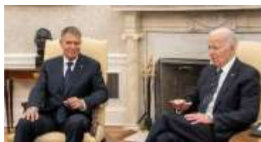
Pentru mai multe imagini click pe poză

Transcrierea intervențiilor din deschiderea întrevederii: